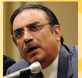
Asif Ali Zardari

El 9 de setiembre, Asif Ali Zardari, viudo de la asesinada ex primera ministra pakistaní Benazir Bhutto, asumió la presidencia de Pakistán, tras casi nueve años de gobierno de Pervez Musharraf, quien en agosto pasado se vio forzado a dimitir por la presión social y política. Cabe señalar que Zardari pasó varios años en prisión por cargos de corrupción (algunos lo llamaban "Sr. 10%") cuando era parte del gobierno de su esposa; sin embargo, él señala que fue un preso político sin cargos demostrados. Ahora tendrá que enfrentar el resurgimiento talibán y los problemas económicos.